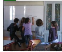
Les CM2 de Pont National au travail pour l'éditorial et les chapeaux